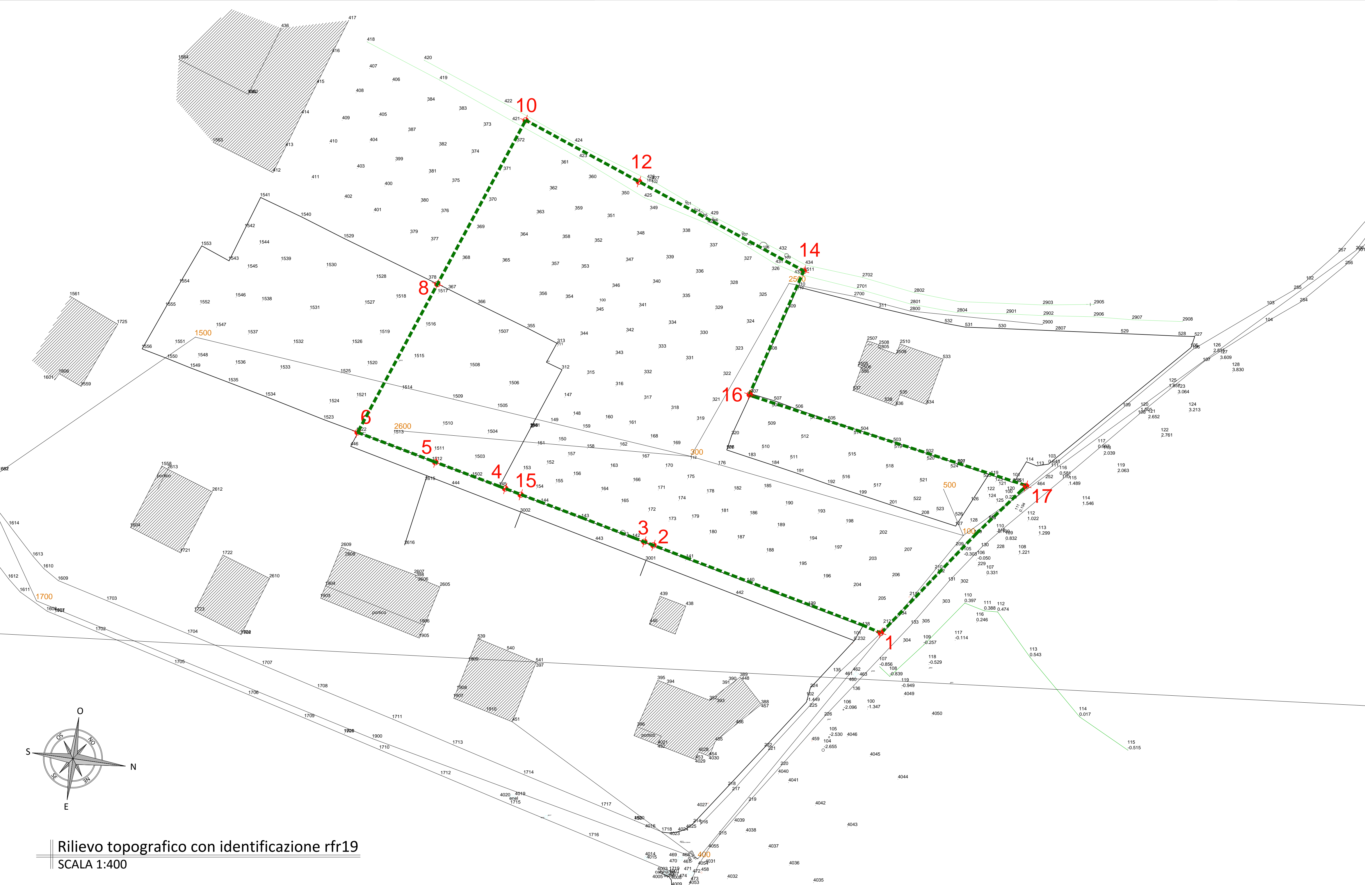
Rilievo topografico con identificazione rfr19 SCALA 1:400